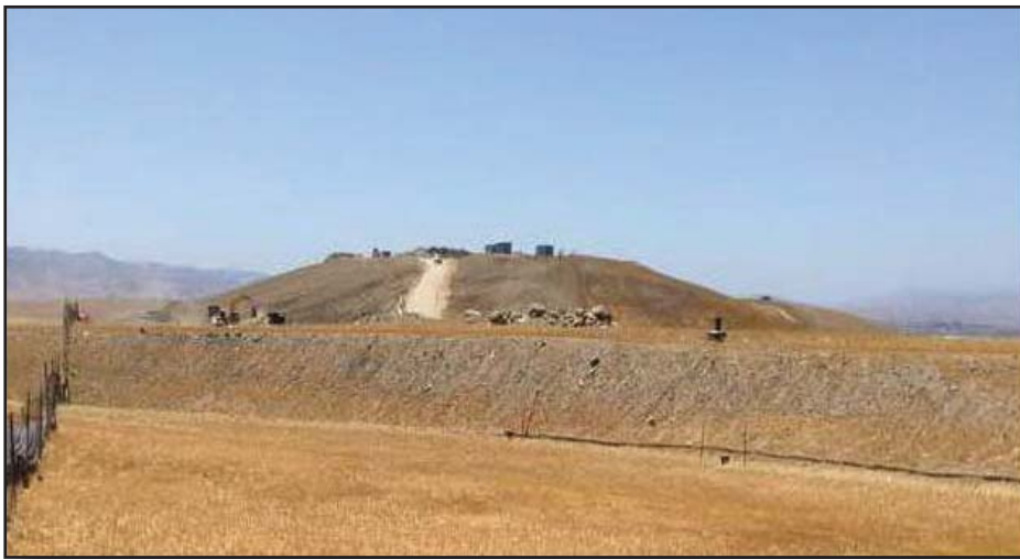
View to west toward southern portion of Class I area showing elevated area from soil placement

The Department of Toxic Substances Control (DTSC) invites you to review and comment on the Resource Conservation and Recovery Act (RCRA)-equivalent Hazardous Waste Facility Draft Post Closure Permit (Permit) for the John Smith Road Landfill Class I Area located at 2650 John Smith Road Landfill in Hollister, California 95023 (Facility). The Facility, which encompasses approximately 5.11 acres, operated between 1977 and 1983 as a disposal facility for liquid hazardous waste. Closure of the Facility, including two surface impoundments, was completed in 1992. Required post closure activities include maintenance and operation of a cover system and environmental monitoring. In 1996 and 2003, DTSC issued hazardous waste post closure permits to the Facility to conduct these post closure activities. The Permit would allow the Facility to continue to conduct post closure activities for another 10 years. The Permit was developed after DTSC completed a detailed technical review of the permit application and is intended to ensure that the Facility operates in a manner that protects human health, safety, and the environment.