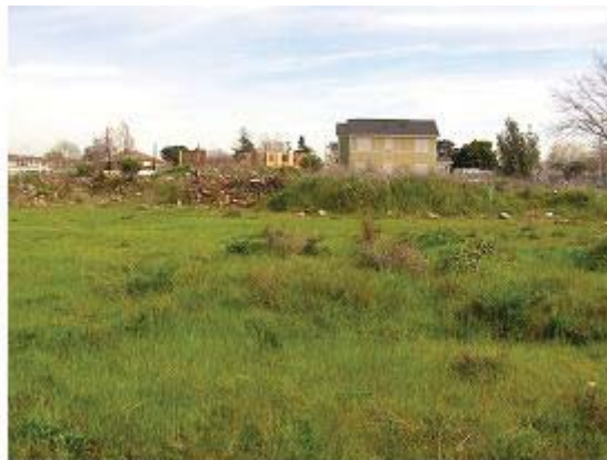
Vista de la característica mientras que hace frente a sureste hacia la característica de HHEB en la avenida de 10900 Edes, que está experimentando la construcción.

Habitat for Humanity East Bay (HHEB, por sus siglas en inglés) está proponiendo construir viviendas unifamiliares a precios módicos en 10800 Edes Avenue en Oakland (ver el mapa en la página 2). Previo al inicio de las obras, HHEB debe limpiar el terreno para cerciorarse que es seguro para uso residencial. El Departamento de Control de Sustancias Tóxicas (DTSC, por sus siglas en inglés), el cual forma parte de la Agencia de Protección Ambiental de California, está supervisando la limpieza medioambiental en la propiedad.